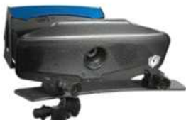
정밀 스캐너(4DL R30X)

3D 스캐너에 대해 많은 분들이 전화나 메일로 많이 문의를 하십니다. 3D 스캐너에 대한 기본 지식을 가지고 문의하시는 분들도 있는 반면 대부분 3D 스캐너에 대해 잘 모르고 주변의 권유 또는 여러 경로로 접하시고 문의를 하는 분이 많습니다. 따라서 여러분의 궁금한 점을 기초부터 하나씩 천천히 알려드리려고 합니다.