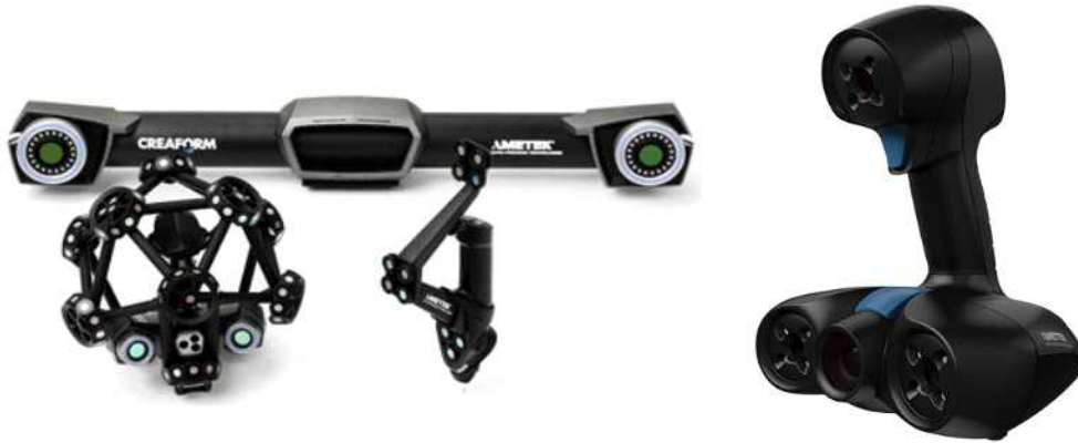
중대역 스캐너, 핸드스캐너